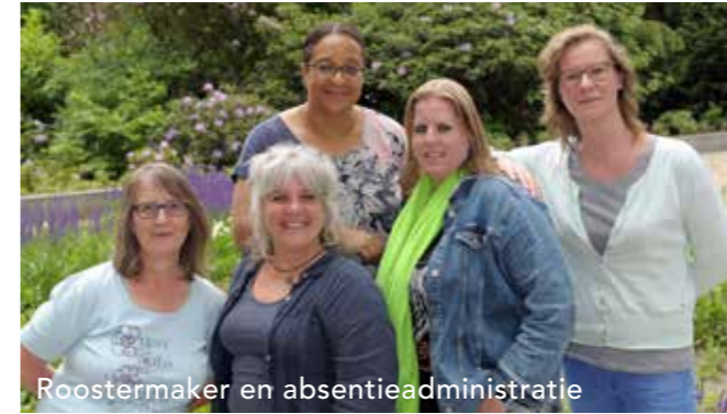
Roostermaker en absentieadministratie