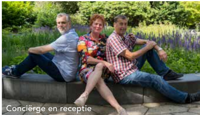
Conciërge en receptie