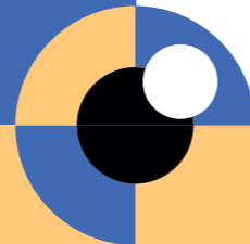
Algemeen Team Focus rebound@volant.nl